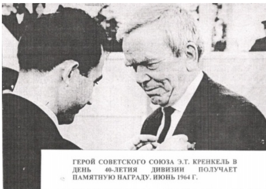
ГЕРОЙ СОВЕТСКОГО СОЮЗА Э.Т. КРЕНКЕЛЬ В ДЕНЬ 40-ЛЕТИЯ ДИВИЗИИ ПОЛУЧАЕТ ПАМЯТНУЮ НАГРАДУ. ИЮНЬ 1964 Г.

правительственного задания в период работы на станции